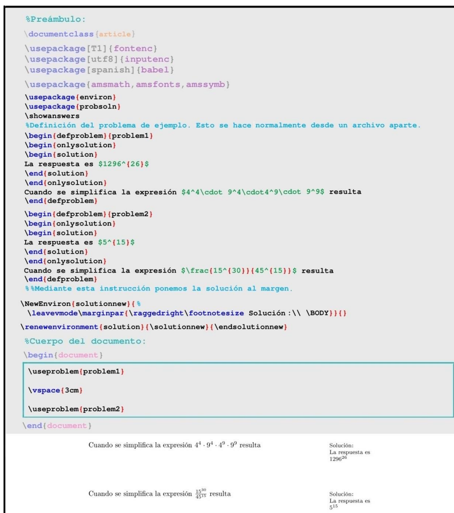
Figura 5. Ejemplo de utilización del paquete probsoln

Como con las otras opciones que comentaremos a continuación, se puede elegir entre cargar aleatoriamente una serie de ejercicios o indicar específicamente cuáles se quieren incluir. También se puede mostrar la solución junto a cada problema (véase la figura 5).